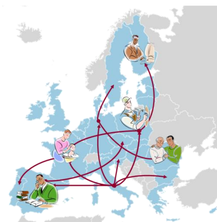
Il permesso di soggiorno CE